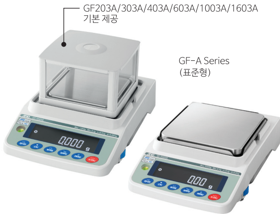
GF203A/303A/403A/603A/1003A/1603A 기본 제공