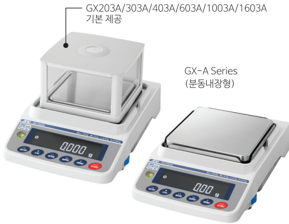
GX203A/303A/403A/603A/1003A/1603A 기본 제공