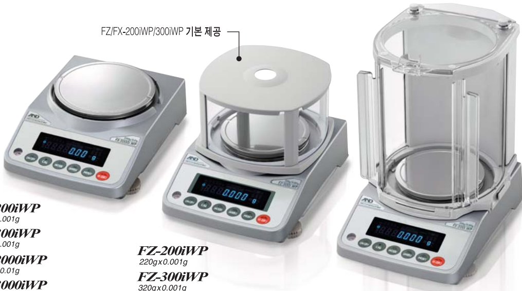
FZ/FX-200iWP/300iWP 기본 제공

방진 · 방수 Balance IP 65 분동내장형 Balance (FZ-iWP)